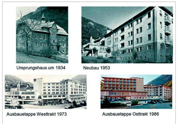
Visper Spitalgeschichte. Der letzte Ausbauschritt erfolgte 1986. Ab circa 2025 wird der Standort als Spital geschlossen. Es folgt die Umnutzung in ein Gesundheitszentrum.